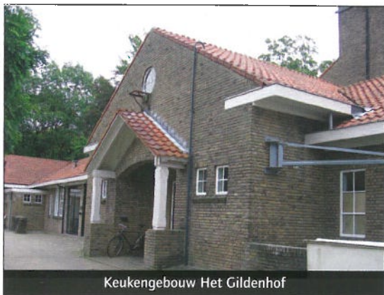
Keukengebouw Het Gildenhof

Zoals sinds circa 1885 gebruikelijk was voor gestichten, werd Zon & Schild opgezet volgens het paviljoenstelsel. Daarbij kreeg iedere functie een eigen gebouw en wer-