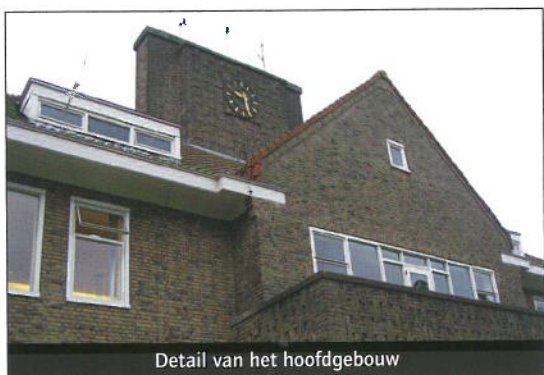
Detail van het hoofdgebouw

Psychiatrisch centrum Zon & Schild is een complex van verschillende paviljoens in een bosrijke omgeving. Het is in de jaren 1928-1940 gerealiseerd naar ontwerp van de architecten G. van Hoogevest uit Amersfoort en de gebroeders J.G. en P.K. Mensink uit Apeldoorn. De opdrachtgever was de Vereniging Nederlands Hervormde Stichtingen voor Zenuw- en Geesteszieken.