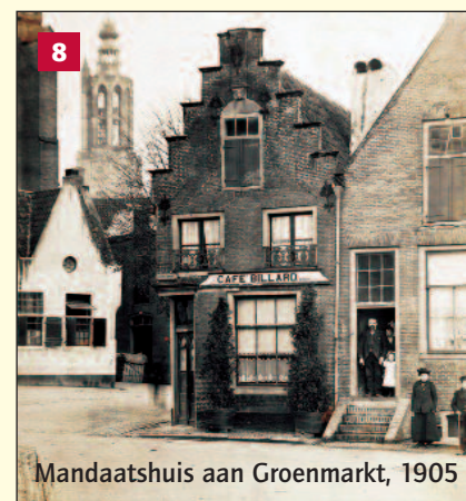
Mandaatshuis aan Groenmarkt, 1905

Het bouwvallige pand uit circa 1530 is in 1941 gerestaureerd, waarbij de gevel aan de Groenmarkt werd gereconstrueerd in nederrijnse baksteengotiek. Men verwijderde de 19e-eeuwse pleisterlaag en brak de gevels tot de pui af om ze opnieuw op te trekken. Op basis van de aangetroffen bouwsporen is het ontwerp aangepast. Zo werden de roedenverdeelde vensters vervangen door kruisvensters met glas-in-lood. Tegenwoordig zijn we hierin terughoudender: latere wijzigingen kunnen ook van architec-