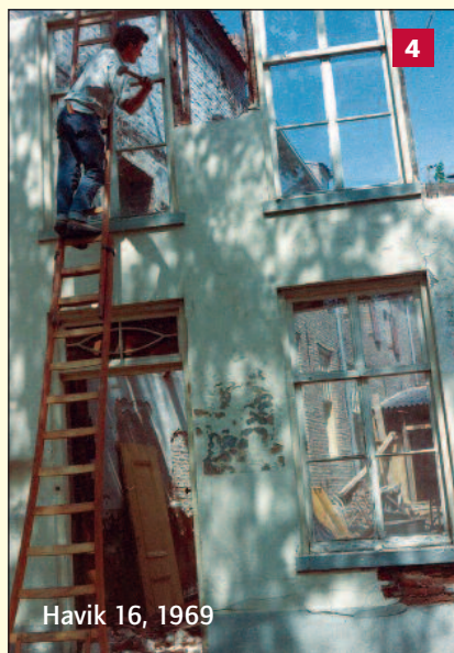
Havik 16, 1969